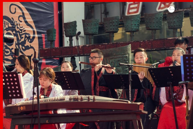
宫廷大乐——商代大铙