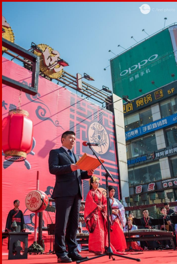
副市长邱继兴为首届大汉婚典新人证婚